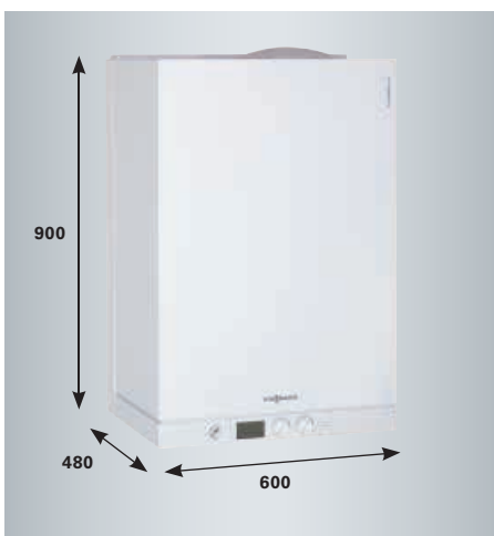
Compacte, silencieuse et d'un design avantageux, la Vitodens 111-W s'intègre facilement à son environnement