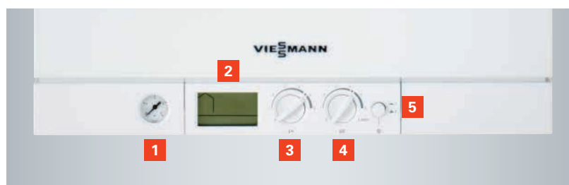
Régulation avec système de diagnostic intégré

Le brûleur Matrix cylindrique, conçu et fabriqué par Viessmann, se caractérise par une grille de combustion en acier inoxydable, véritable gage de longévité.